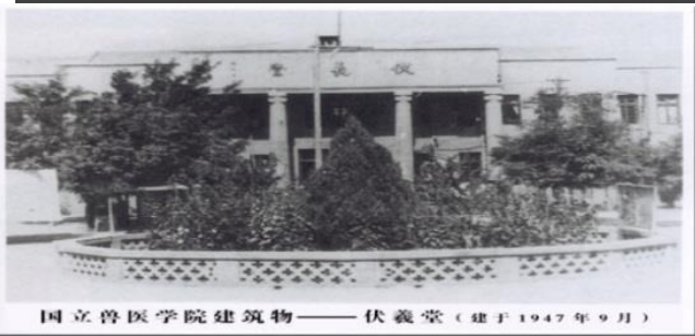
国立兽医学院建筑物——伏羲堂（建于1947年9月）