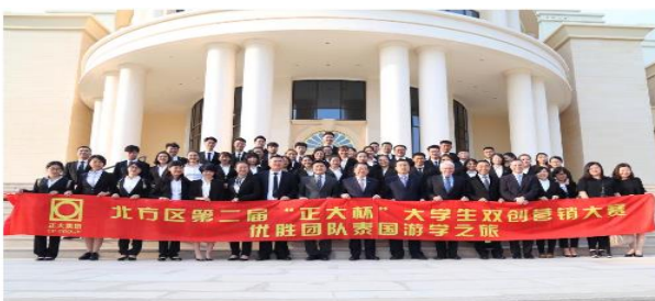
2018年，我校学生团队获“正大杯”大学生创新创业营销大赛甘肃赛区冠军，并受邀赴泰国游学。