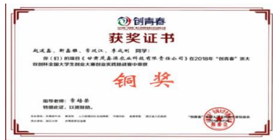
2018年，我校学生创业项目在教育部、人社部主办的“创青春”全国大学生创业大赛中获得铜奖。