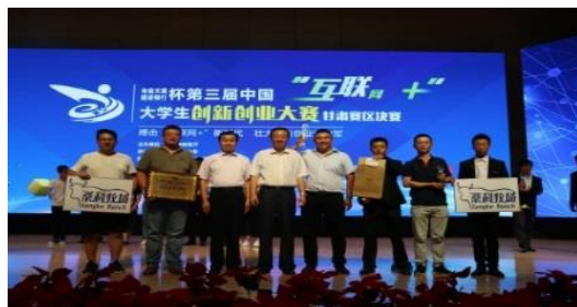
“桑科牧场”在2017年的第三届“互联网+”创新创业大赛中，获得甘肃省初创组第一名及国家级铜奖。